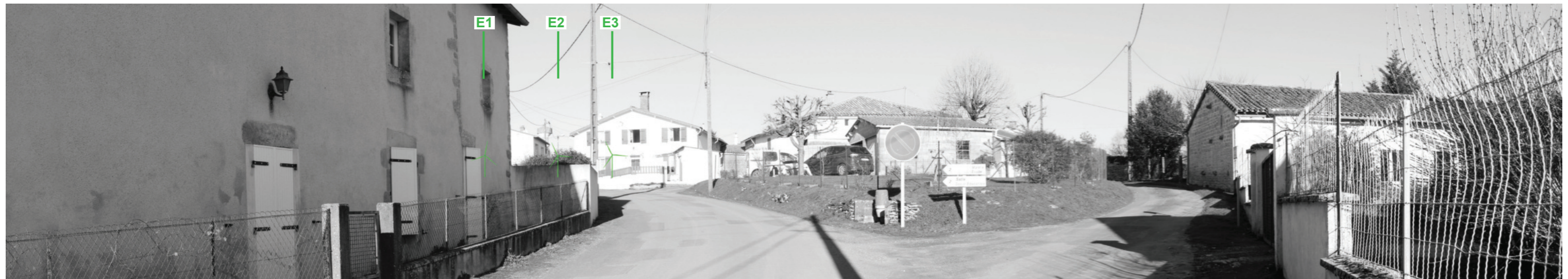
Vue panoramique noir et blanc avec esquisse du projet (angle de vue 120°)