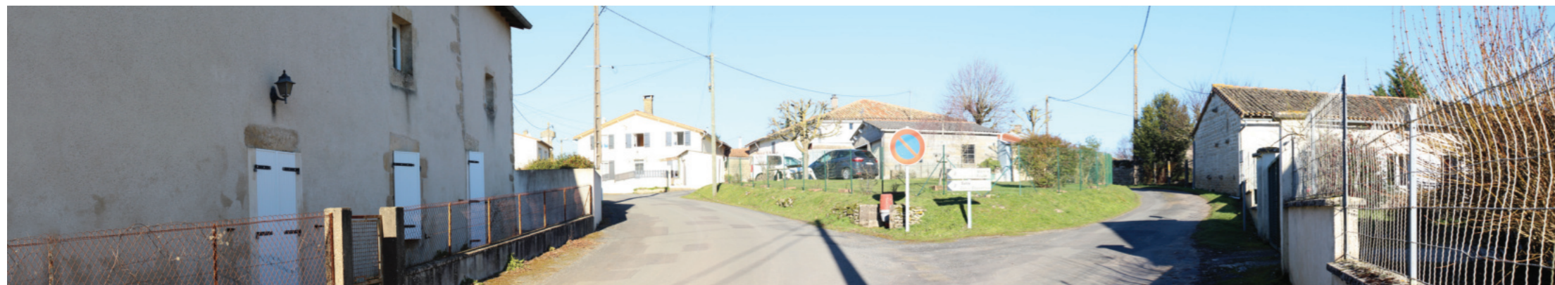
Vue panoramique de l'état initial (angle de vue 120°)