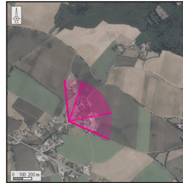
Orthophotographie 1 / 25 000